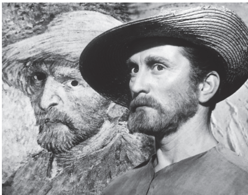
Van Gogh szerepében

1950-ben A bajnok című film ökölvívójáért jelölték először Oscar-díjra, majd az évtized során még kétszer: 1953-ban A szörnyeteg és a szépség, 1957-ben A nap szerelmese című filmért. Az igazi hírnevet ez utóbbi hozta meg számára, a festő Vincent van Gogh megszemélyesítéséért elnyerte a Golden Globe-díjat. Ezután olyan kasszasikerek következtek, mint a Stanley Kubrick által rendezett Spartacus (1959), a Telemark hősei (1978) és a Végso visszszámolás (1980).