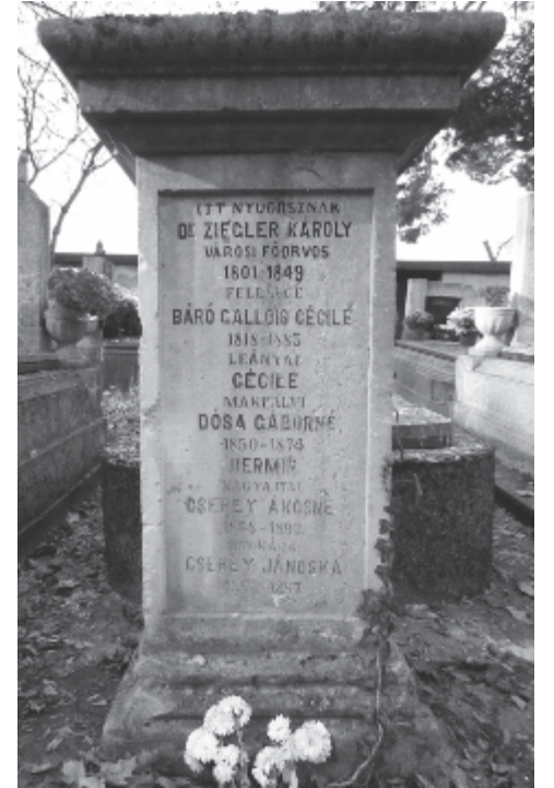
A Ziegler család legrégebbi sírköve a marosvásárhelyi temetőben