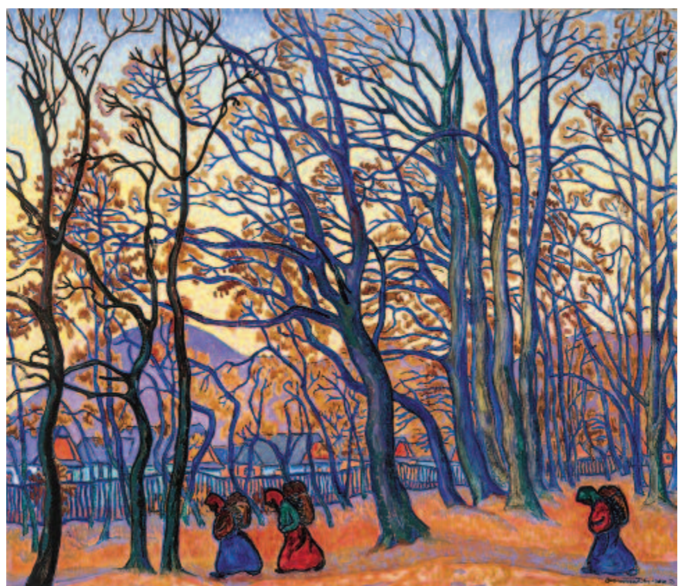
Rőzsehordók a ligetben

A Naplemente ugyanabból a korszakból származik, mint a Poros út című Munkácsy-festmény, amelyet 2003-ban a Virág Judit Galériában (korábban: Mű-Terem Galéria) adtak el 220 millió forintért, és amely évekig tartotta a magyar aukciós rekordot. A magyar festőóriás, Munkácsy Mihály a nagy amerikai gyűjtőknek köszönhetően már életében rendkívül népszerű volt a tengerentúlon. A San Franciscóban 1915-ben nyílt Panama-Pacifik nagyszabású világkiállításán is szerepelt a Munkácsy-kép, amelyet Andrássy gróf kölcsönözött a tárlatra. A háborús viszonyokra hivatkozva az Európából érkező anyagot nem küldték vissza a szervezők. Amikor az Egyesült Államok is belépett a háborúba, az ellenséges állammá nyilvánított Magyarország kollektíváját zár alá helyezték, a kiállítást